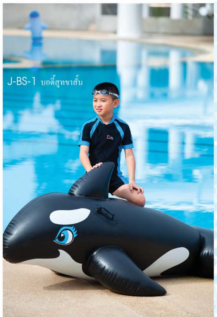
J-BS-1 บอดี้สูทขาสั้น