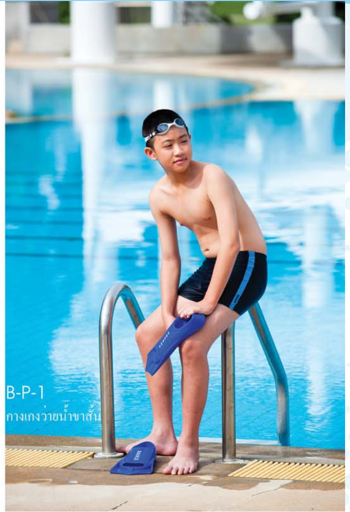
B-P-1 กางเกงว่ายน้ำขาสั้น