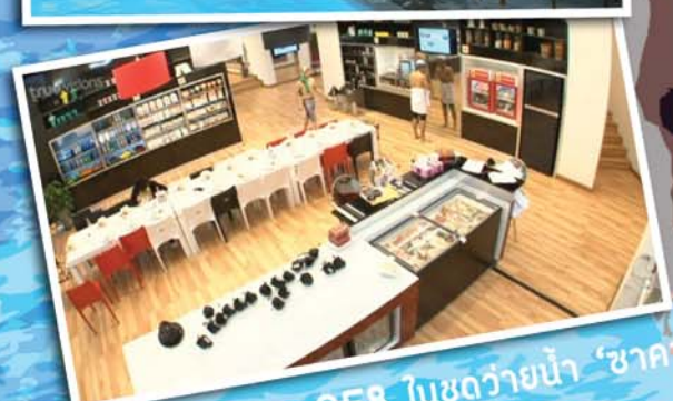
นักล่าฝันในบ้าน AF8 ในชุดว่ายน้ำ 'ซาคานา'