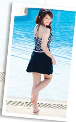
Two-piece เสื้อและกางเกงขาสั้นติดกระโปรง