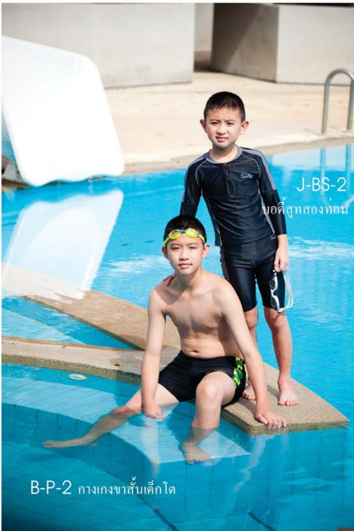
J-BS-2 บอดี้สูทสองท่อน